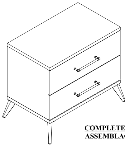
COMPLETE ASSEMBLY / ASSEMBLAGE TERMINE